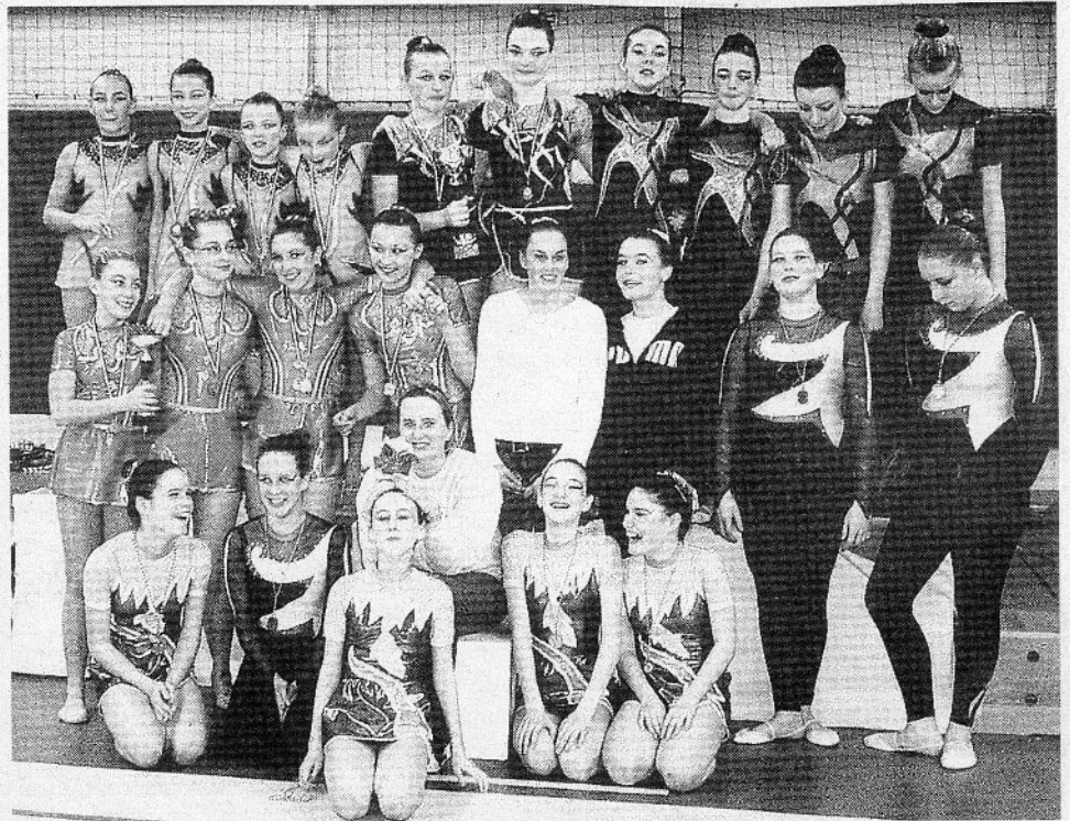
Les gymnastes récompensées

Ce championnat auquel participaient des jeunes filles de 9 à 18 ans était qualificatif pour le championnat régional.